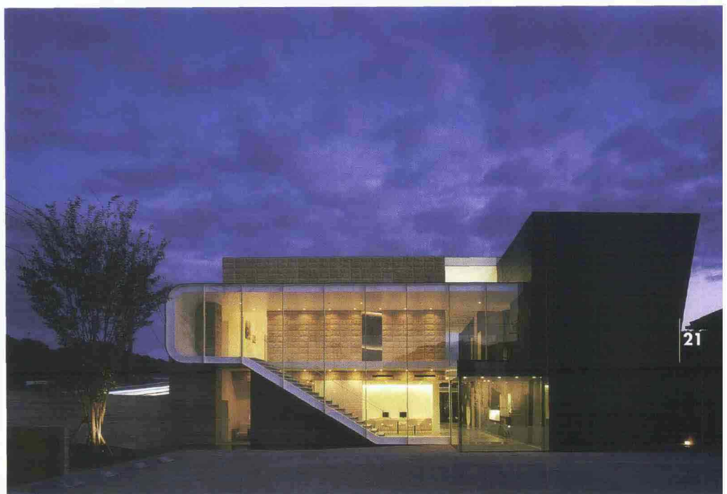
Above: two views of Casa De Risi designed by Sergio Bianchi and built in Bellegra, near Rome. In the middle: view from above of the Chiesa del Santo Volto designed by Mario Botta in Turin. Right: Holocaust Educational Center commissioned to the young Keisuke Maeda.