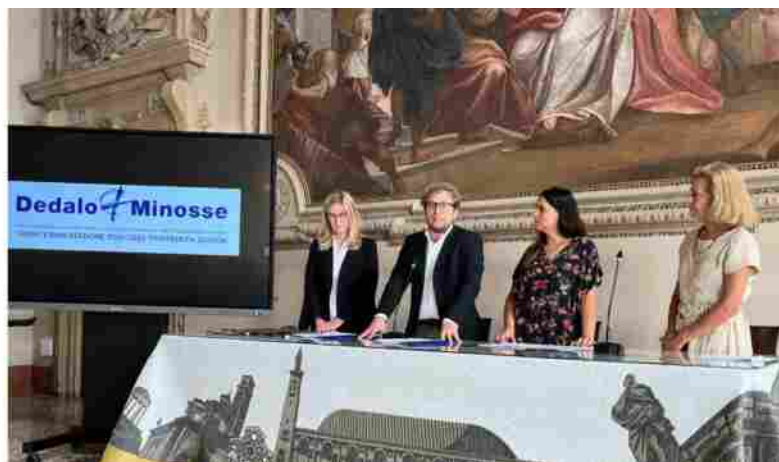
La presentazione del Premio Dedalo Minosse in Sala Stucchi a Palazzo Trissino