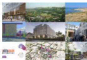
Premio Urbanistica, proclamati i vincitori