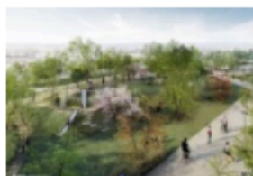
Segrate (Milano): Milano4You, primo smart district in Italia