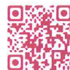
Sito web del premio Dedalo Minosse

Ora il Premio inizia come di consueto due roadshow biennali. Uno in Italia, con prima tappa Firenze e, a seguire Roma, Milano, Pisa, Cosenza, Palermo, Bolzano, Bologna. All'estero, invece, toccherà le città di San Francisco, Gerusalemme, Sofia, Detroit, San Paolo, Tokyo, Belgio, Svizzera e Dubai. In questo modo, le opere eccellenti dei colleghi italiani saranno esposte in tutto il mondo, assieme a quelle dei committenti stranieri, a promuovere la professionalità e la capacità creativa e realizzativa del nostro Paese. ■