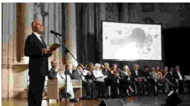
L'ultima premiazione del "Dedalo Minosse" al Teatro Olimpico

dalo Minosse, dedicato alla committenza d'architettura, promosso da Ala, Associazione Liberi Architetti: le opere del 2018/2019 vanno segnalate entro fine maggio, la giuria sarà al lavoro d'estate e i selezionati saranno avvisati per la spedizione dei materiali utili alla mostra. La premiazione si terrà il 21 settembre all'Olimpico. ●N.M.