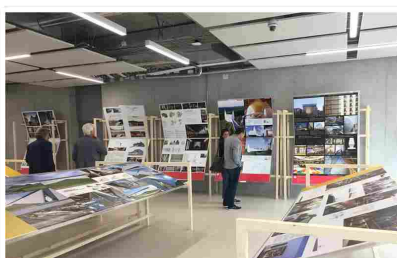
Ausstellung zum bekannten "Dedalo Minosse Preis" im NOI-Techpark