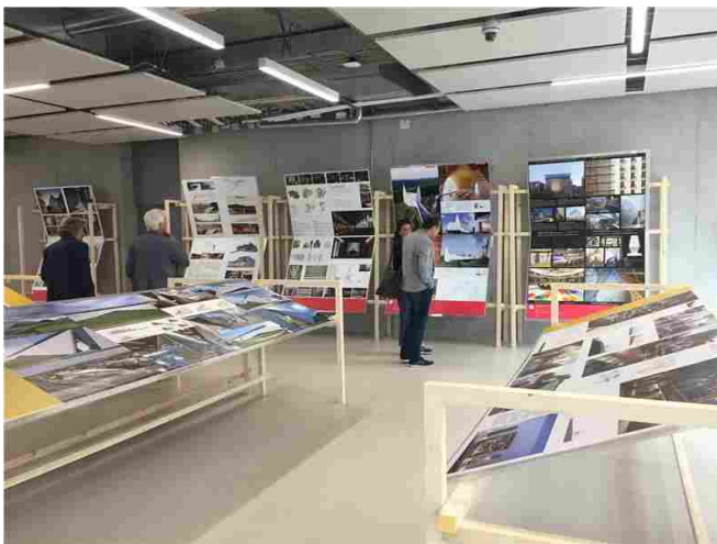
Ausstellung zum bekannten "Dedalo Minosse Preis" im NOI-Techpark

Mit dem Architekturpreis „Dedalo Minosse“ prämierte Projekte sind nun im NOI-Techpark in Bozen zu sehen, darunter auch die Messner-Mountain-Museen.