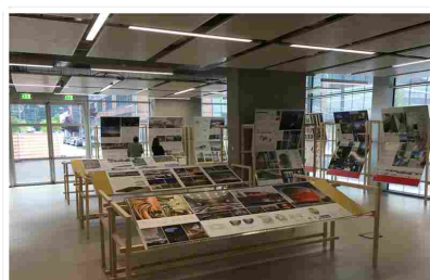
Zu sehen sind bei der Ausstellung auch die Projekte für die sechs Messner Mountain Museen des Alpinisten Messner