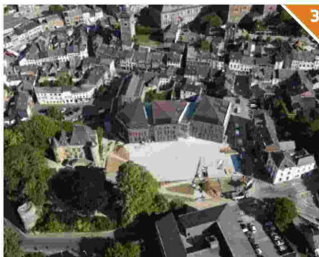
Il nuovo polo municipale di Gembloux (Belgio), città medioevale della Vallonia, progettato da Demogo, Studio associato di Treviso che ha ricucito il tessuto urbano esistente.