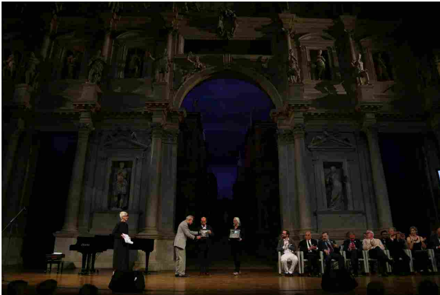
Premio Internazionale Dedalo Minosse

Realizzazione: 2014, Ablaint Saint Nazaire, Hauts de France, France