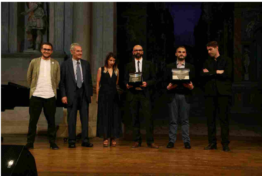
Premio Ala Under 40

Realizzazione: 2015, Gembloux, Namur, Belgium