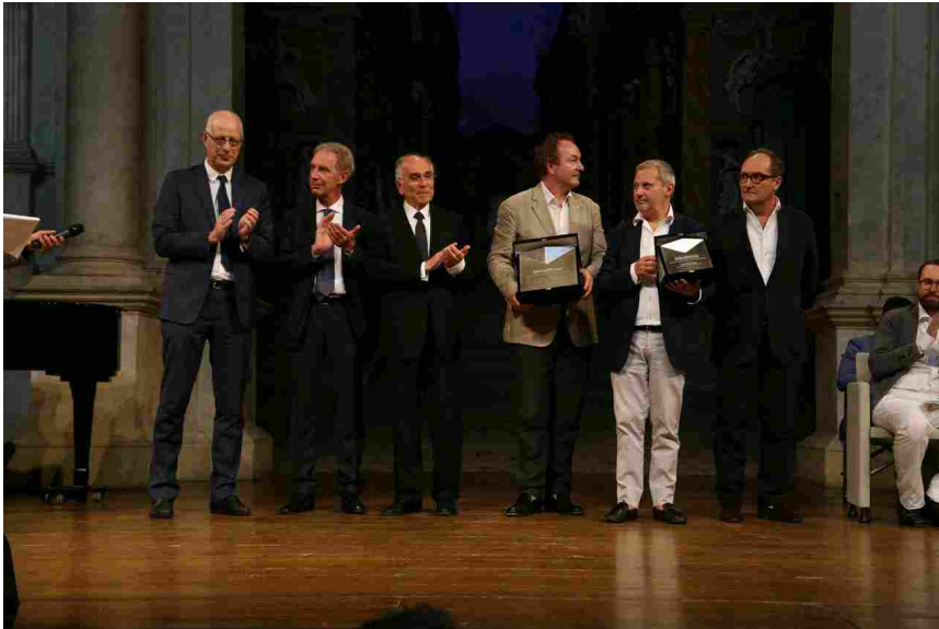
Premio Ala-Fondazione Inarcassa

Realizzazione: 2013, The Chilterns, Oxfordshire, United Kingdom