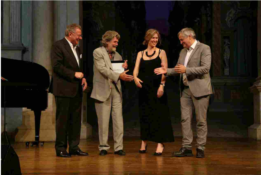
Premio Palladio Italia

Realizzazione: 1995-2015 Provincia di Bolzano e Provincia di Belluno, Italia