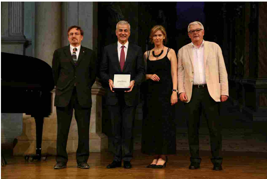
Premio Palladio International