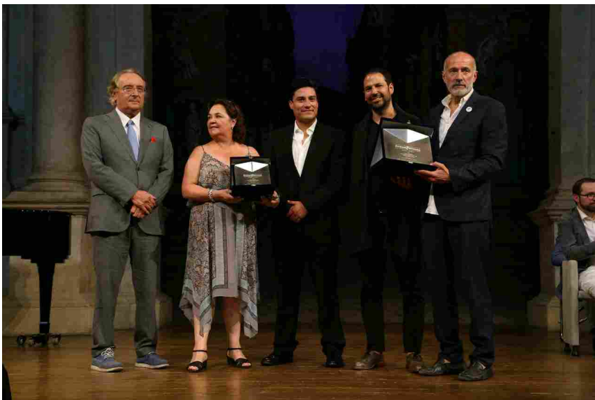
Premio OCCAM Under 40

Realizzazione: 2013, Tepoztlán, Morelos, México