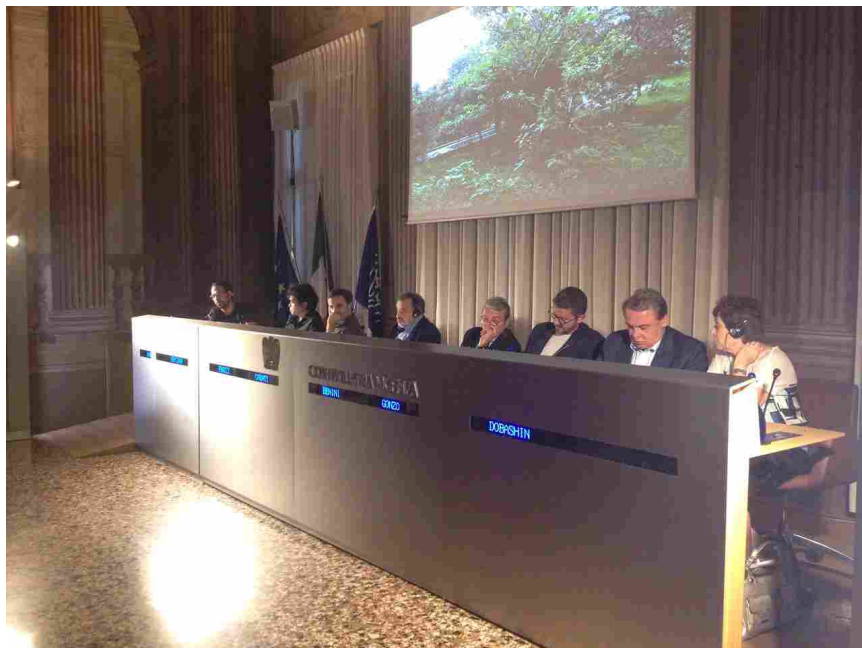
Premio Dedalo Minosse