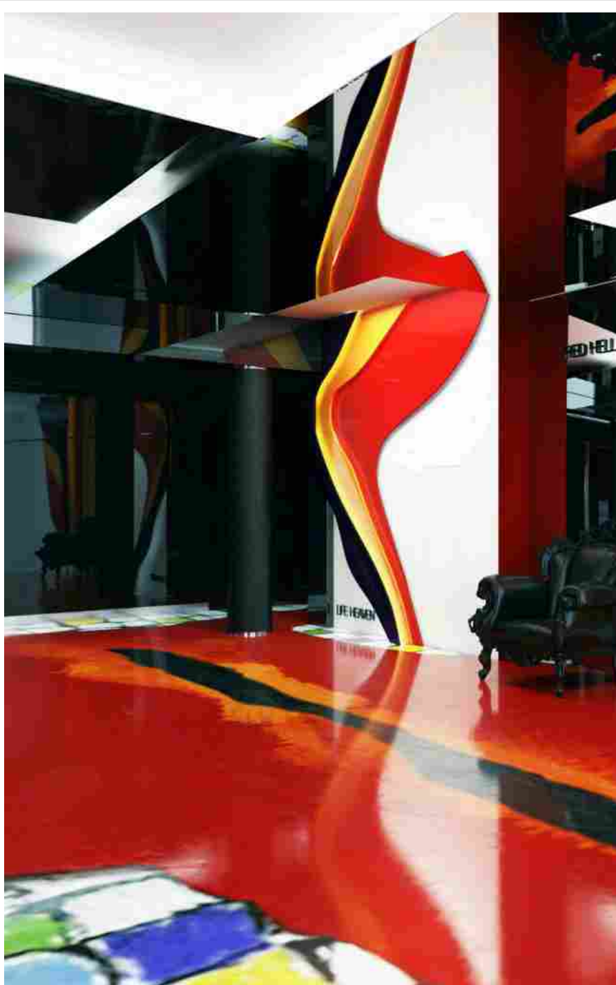
Dante O. Benini & Partners Architects