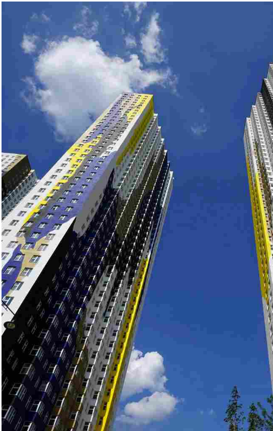
Dante O. Benini & Partners Architects