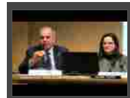
Convegno Apindustria Vicenza: alternanza scuola