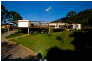
Nella foto di archivio del Premio Internazionale Dedalo Minosse - Occam Under 4, la realizzazione è ubicata in un paesaggio favoloso tra le montagne a nord di San Paolo, la casa per vacanze Grid House si propone d'instaurare un dialogo tra natura e costruito.

Ancora una volta saranno due i luoghi Palladiani a ospitare la kermesse del Premio, una «passerella» di committenti, architetti, esperti e appassionati che festeggiano l'architettura, raccontando le proprie storie.