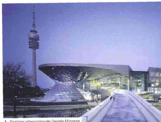
1 - Sezione internazionale Dedalo Minosse

PATROCINI: Conferimento della medaglia del Presidente della Repubblica Italiana quale Premio di Rappresentanza, Presidenza del Consiglio dei Ministri, Parlamento Europeo, CICT-UNESCO Comitato Italiano, OCCAM, The Observatory for Cultural and Audiovisual Communication, Comune e Provincia di Vicenza, ANCI (Associazione Nazionale Comuni Italiani), CNI (Consiglio Nazionale degli Ingegneri), Ordine degli Architetti, P.P.C. di Vicenza, Ordine degli Architetti, P.P.C. di Roma, C.C.I.A.A. Vicenza, Inarcassa, INARCH, AIA International Committee, AIA San Francisco Chapter, Confprofessioni, Confindustria Marmomacchine, ISES Italia, Sezione italiana della International Solar Energy Society, ADI (Associazione per il Disegno Industriale), Construmat Barcelona, Fondazione Ippolito Nievo, Coordinamento Nazionale dei Giovani Architetti Italiani VAGA (Associazione Giovani Architetti della Provincia di Vicenza), United Architects of Philippines Union of Moscow Architects, IUAV Venezia