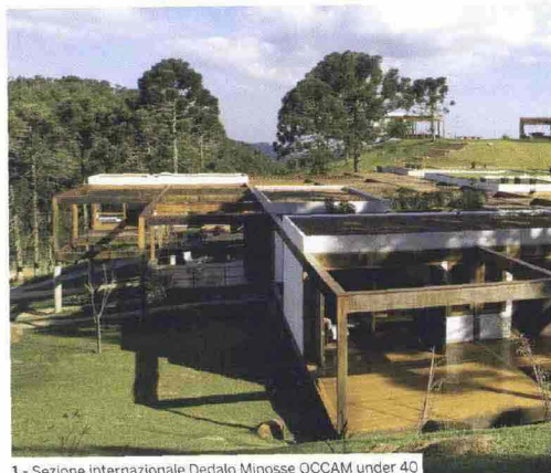
1 - Sezione internazionale Dedalo Minosse OCCAM under 40