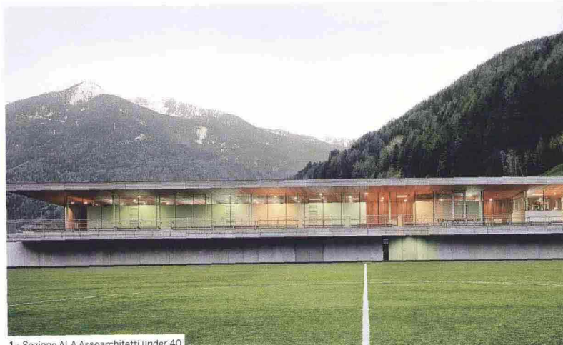
1 - Sezione ALA Assoarchitetti under 40