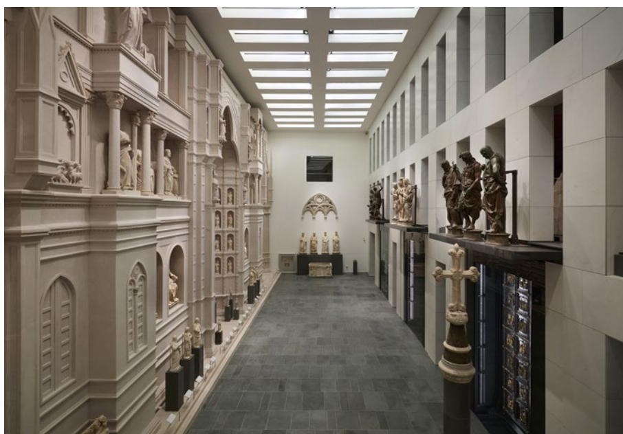
2. Museo dell'Opera del Duomo di Firenze, commissionata dall'Opera di Santa Maria del Fiore di Firenze, Fabbriceria fondata dalla Repubblica Fiorentina nel 1296, oggi impegnata nella tutela, salvaguardia e conservazione del patrimonio artistico storico e culturale. L'espansione dell'area espositiva ha consentito la rivalutazione della struttura attraverso un progetto museologico responsabile che tenesse conto del cantiere complesso e delicato, del budget e dei tempi di realizzazione. Natalini Architetti, Guicciardini & Magni Architetti, Mons. Timothy Verdon (progetto museologico).

Diversissimo il contesto del Museo dell'Opera del Duomo di Firenze (figura 2), che raddoppia i propri spazi con una sapiente opera di affiancamento di antico e moderno, integrazione tra architetture e programma espositivo, e infine tra museo e città.