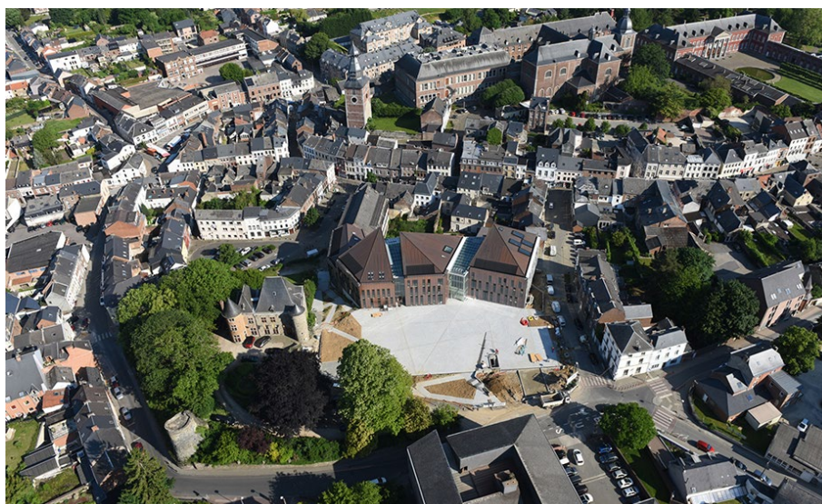
4. Il nuovo Municipio di Gembloux, affidato con concorso allo studio di architettura italiano DEMOGO.