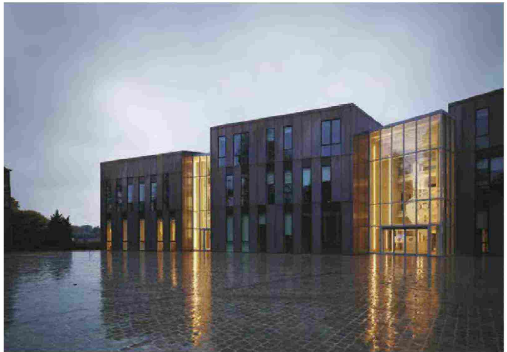
Belowe, the Town Hall of Gembloux, Belgium, by DEMOGO architecture studio.

the interaction between the park and the city, harmonizing the project with the existing urban fabric thanks to the generative views over the symbols of Gembloux; this was done by fragmenting the new administrative centre into smaller elements conforming to the urban scale.