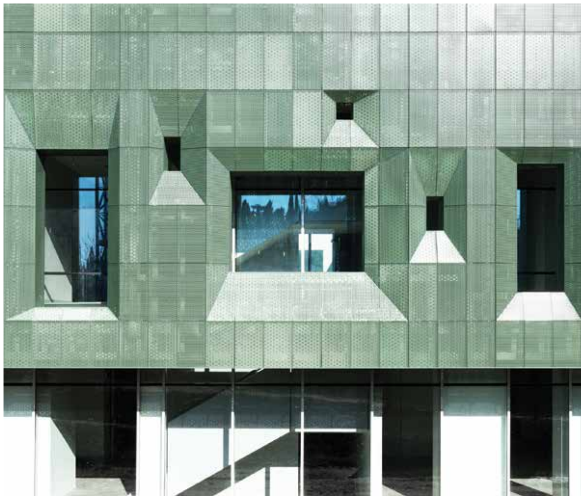
Casa Verde 2016, San Miniato, Pisa, Italy

Client: IRCCS Fondazione Stella Maris Project: LDA.iMdA Architetti Associati