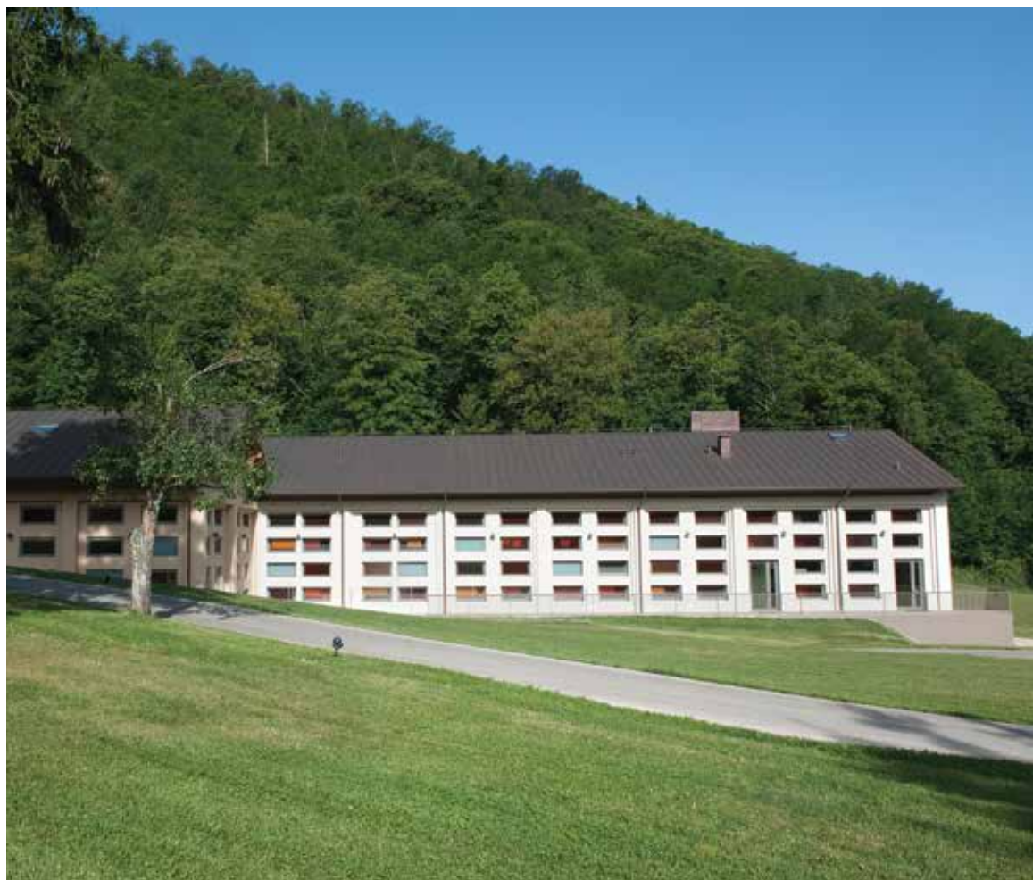
Dynamo Camp 2016, San Marcello Piteglio, Pistoia, Italy